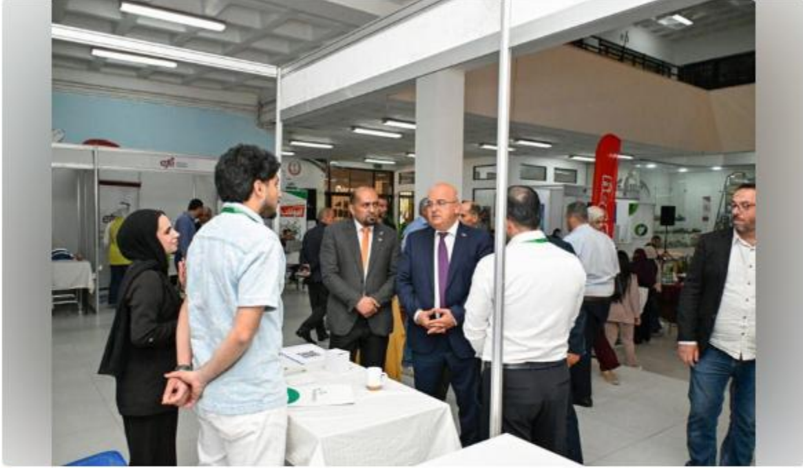
الجامعة الهاشمية تطلق فعاليات اليوم الوظيفي 2026

الزرقاء 19 أيار (بترا)- أطلقت الجامعة الهاشمية فعاليات "اليوم الوظيفي 2026" والذي نظّمته عمادة شؤون الطلبة/دائرة الإرشاد الوظيفي ومتابعة الخريجين، بمشاركة 60 شركة ومؤسسة تمثل طيفاً واسعاً من القطاعات المهنية والإنتاجية والخدمية لتوفير فرص التشغيل والتدريب النوعية لطلبة الجامعة وخريجها.